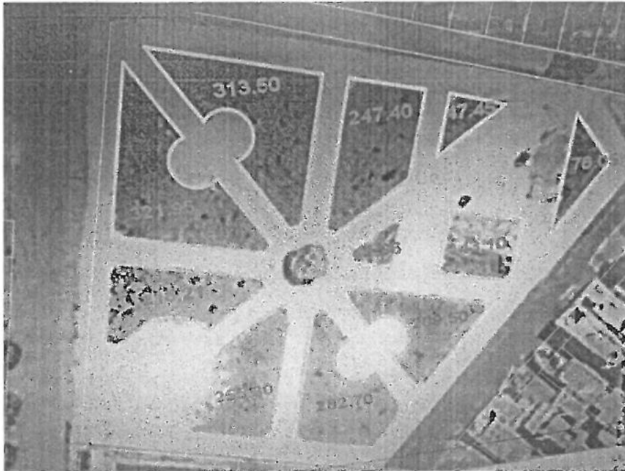
Distribución en m 2 de las áreas verdes del Parque N° 03 (Oliva Razzeto)